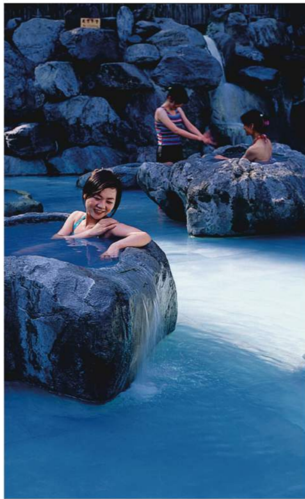
[溫泉中的藍寶石：碳酸氫鈉混合泉]

以「溫泉中的藍寶石」聞名的「鳩之澤」位於「太平山國家森林遊樂區」入口約一公里處，海拔約520公尺。此區舊名「燒水」，日本時期的日本伐木工人在此建造溫泉浴室，並稱之為「鳩澤溫泉」，是當時伐木生活中難得的樂趣。1969年更名為「仁澤溫泉」，2006年重新回復「鳩之澤」原名。目前區內規劃有「鳩之澤溫泉」與「鳩之澤自然步道」，來到此地請用最舒適的節奏，享受森林浴及溫泉浴，讓身心都煥然一新。