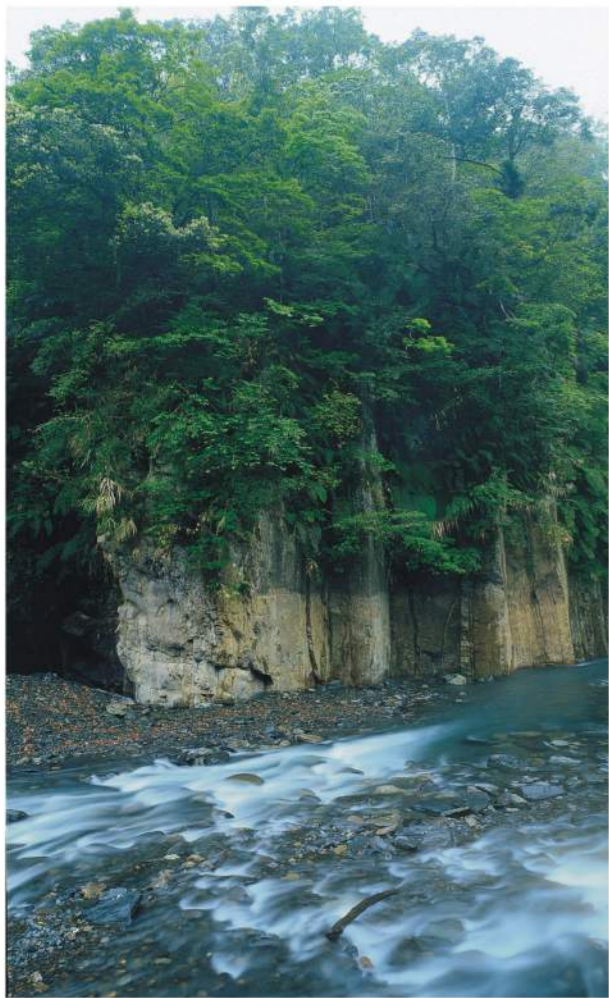
[山水鳥語的綠谷秘境]

以「溫泉中的藍寶石」聞名的「鳩之澤」位於「太平山國家森林遊樂區」入口約一公里處，海拔約520公尺。此區舊名「燒水」，日本時期的日本伐木工人在此建造溫泉浴室，並稱之為「鳩澤溫泉」，是當時伐木生活中難得的樂趣。1969年更名為「仁澤溫泉」，2006年重新回復「鳩之澤」原名。目前區內規劃有「鳩之澤溫泉」與「鳩之澤自然步道」，來到此地請用最舒適的節奏，享受森林浴及溫泉浴，讓身心都煥然一新。